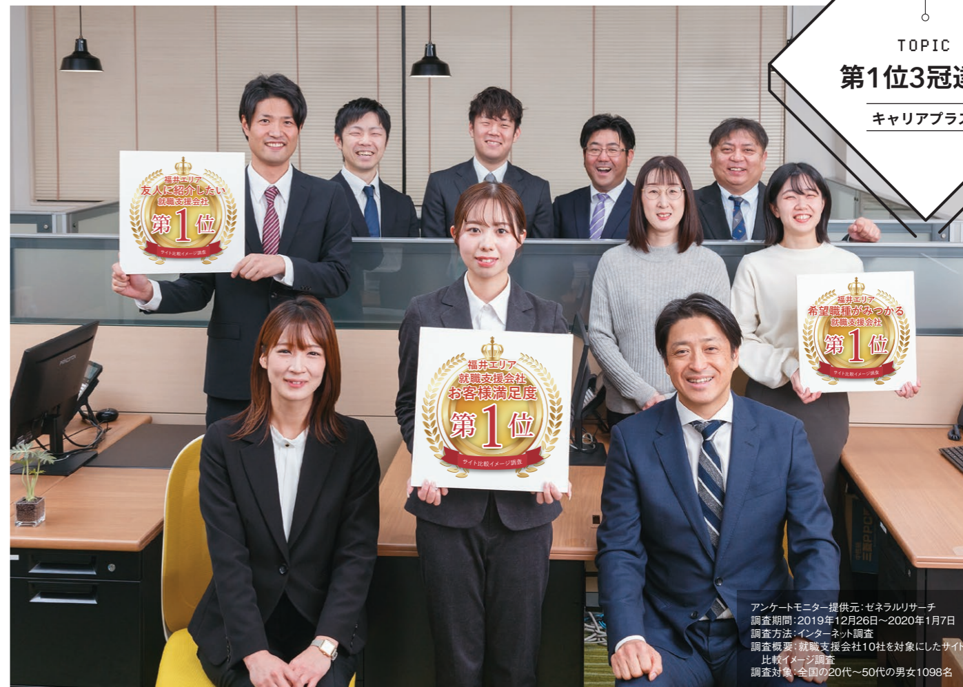
アンケートモニター提供元:ゼネラルリサーチ 調査期間:2019年12月26日~2020年1月7日 調査方法:インターネット調査 調査概要:就職支援会社10社を対象にしたサイト比較イメージ調査 調査対象:全国の20代~50代の男女1098名